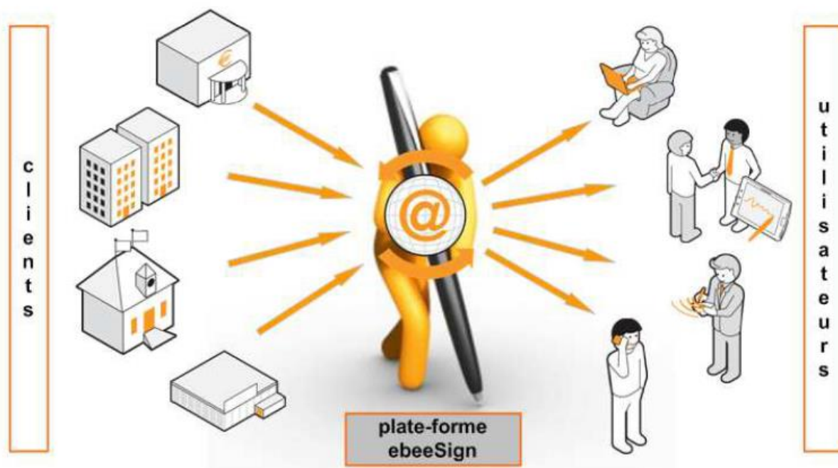
Figure 2 Les Clients et les Utilisateurs du Service de signature électronique be-invest